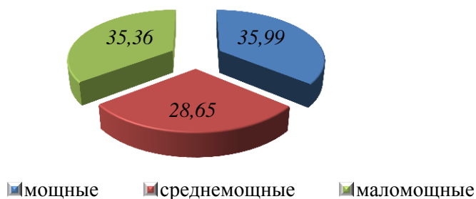
Рисунок 3. Площадные показатели по мощности почв бассейна р.Зея (в %)

Таким образом в выражении площадей по мощности почвенного распределены следующим образом: мощные — 37557,95 га или 35,99%; средне мощные — 29902,41 га или 28,65%; маломощные — 36902,33 га или 35,36%. Данные показатели также, как и показатели гранулометрического состава, при оценки почв, учтени с поправочными коэффициентами.