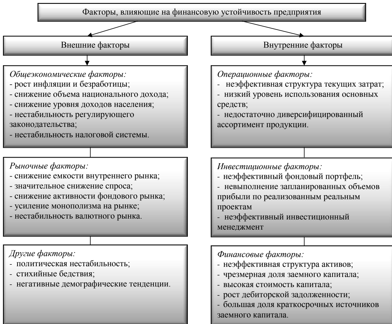
Рисунок 3. Классификация внутренних и внешних факторов, влияющих на финансовую устойчивость предприятия

Таким образом, под финансовой устойчивостью предприятия понимают наличие достаточного объема финансовых ресурсов (преимущественно собственных средств) для обеспечения его бесперебойного и успешного функционирования и развития, а также способность отвечать по своим обязательствам и оставаться платежеспособным вне зависимости от влияния факторов внутренней и внешней среды. На финансовую устойчивость организации влияет большое количество факторов, которые можно разделить на две группы: внутренние и внешние. Внешние факторы предприятию не под силу регулировать, но благодаря разработке стратегии деятельности, учитывающую возможность наступления данных факторов, можно минимизировать их последствия для деятельности предприятия. Разработка и реализация финансовой стратегии должны быть основой управления финансовой устойчивостью предприятия, позволяющей в перспективе повысить устойчивость организации от внешних и внутренних факторов.