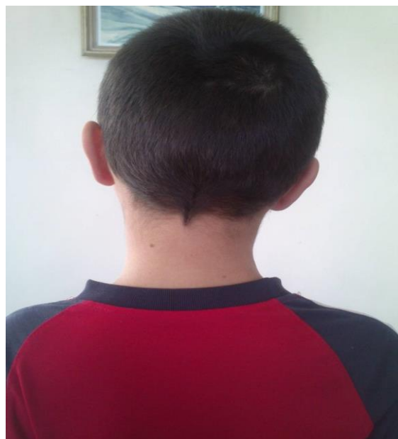
Рисунок 2. Пациент с мышечной кривошеей после проведенного оперативного вмешательства малоинвазивным методом и ношения шейного артезного аппарата через 1 месяц

При этом восстановление непрерывности обеих ножек мышцы произошло у 50(76,9%) больных, ключичной — у 10(15,4%) и грудинной — у 5(7,7%) пациентов.