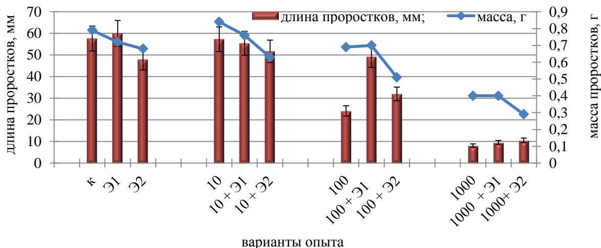
Рисунок 2. Длина и масса проростков лука после обработки ВЭЖШ и различными концентрациями сульфата меди, мкМ