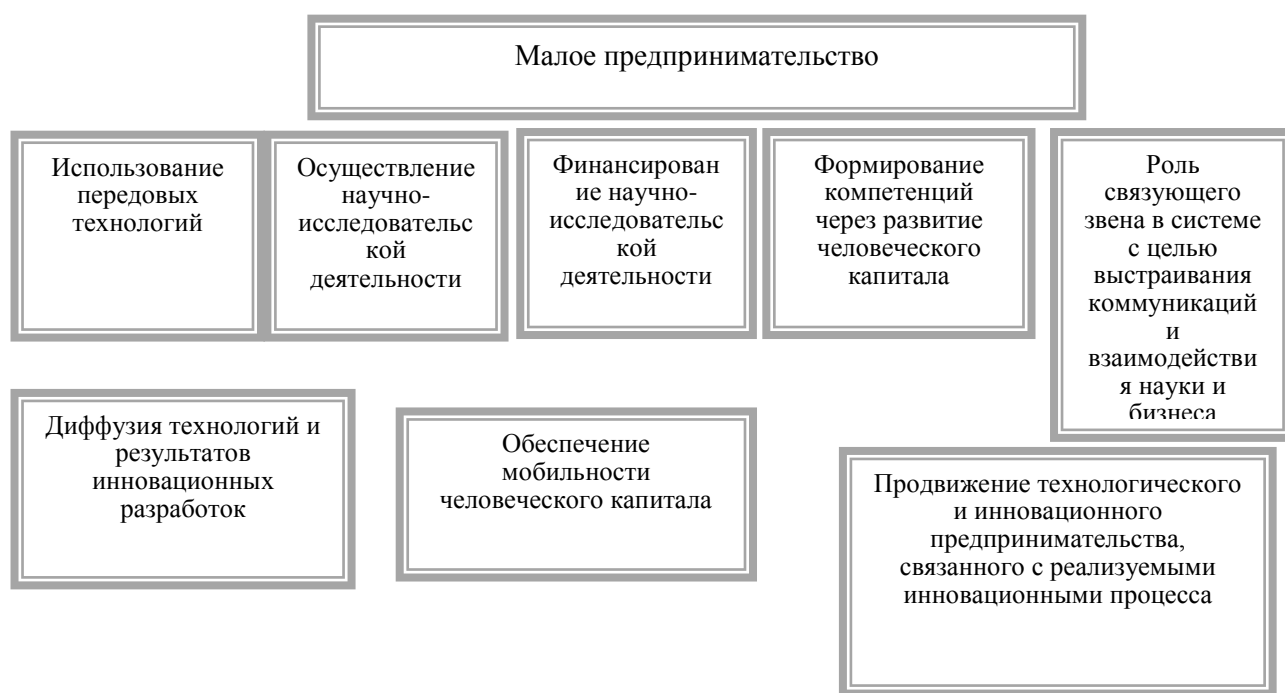
Рисунок. 2 Взаимосвязь инновационной системы и малого предпринимательства